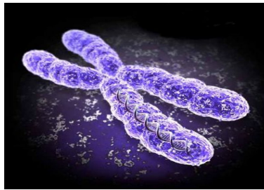
Slika 1: Hromozom

U procesu reprodukcije učestvuju jedinke koje su izabrane u fazi selekcije. Ove jedinke se nazivaju roditelji, dok se procesom ukrštanja dobija jedinka ili dve nove jedinke koje nazivamo neposrednim potomcima. Očekivano je da deca naslede osobine roditelja, uključujući njihovu prilagođenost pa i da budu bolje prilagođene od njih. Postoji nekoliko jednostavnih načina reprodukcije. U jednoj varijanti (jednopoloziciono ukrštanje) dovoljno je odabrati tačku prekida, i prekombinovati nizove podataka. Moguće je i višepoziciono ukrštanje, pri čemu se bira proizvoljan broj tačaka koji mora da bude manji od dužine hromozoma. Kod uniformnog ukrštanja svaki podatak se sa verovatnoćom p prenosi na prvo dete i sa 1 - p na drugo dete. Verovatnoća je obično jednaka 0.5, a može biti i drugačija.